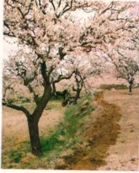
Son Sayının Kapağı