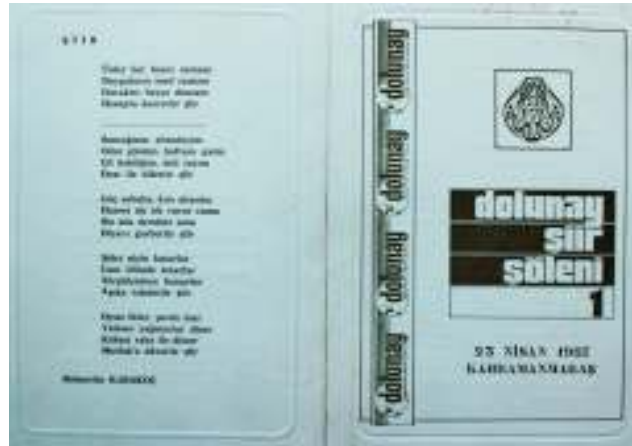
Dolunay Şiir Şöleni I'in Davetiyesi