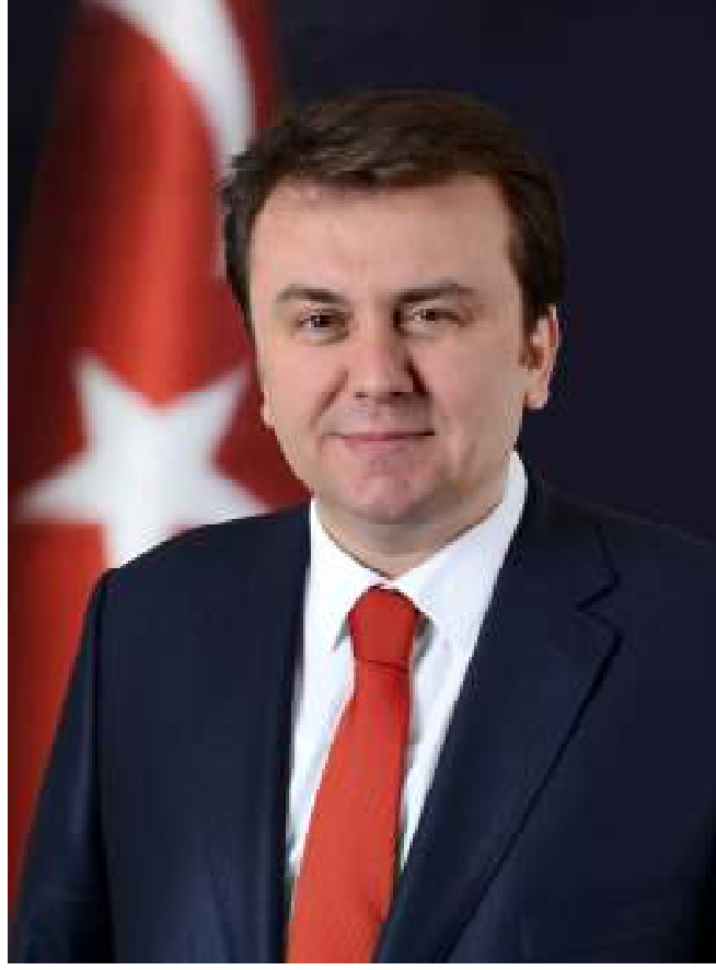
Fatih Mehmet ERKOÇ Kahramanmaraş Büyükşehir Belediye Başkanı